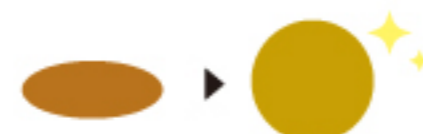
ダメージで潰れたタンパク質